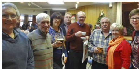
Aanwezig zijn en de handen uit de mouwen steken op de Kerstmarkt in het rustoord hoort ook bij de werking rond OCMW.