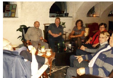
Ook na de raad maken we de evaluatie van onze tussenkomsten en de soms povere reacties van de meerderheid.