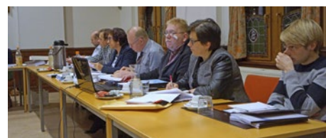
Onze voltallige fractie op de gemeenteraad.