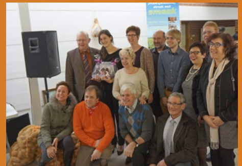
Op de bres voor streekproducten.